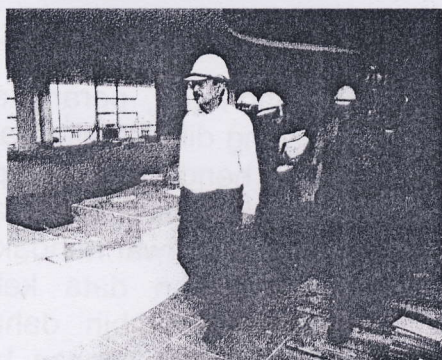
Kerja-kerja pengubahsuaian bangunan rancak dilaksanakan

"Pembukaan UTC ini merupakan yang pertama di Malaysia seiring dengan Program Transformasi Kerajaan (GTG) yang bakal dirasmikan Perdana Menteri, Datuk Seri Najib Tun Razak pada 23 Jun depan.