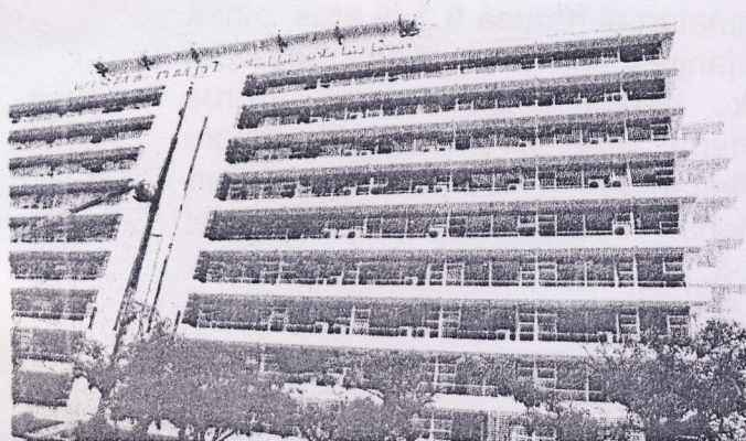
UTC dijadikan pusat perkhidmatan berpusat